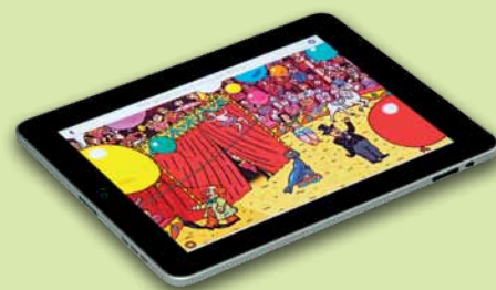
App für iPad